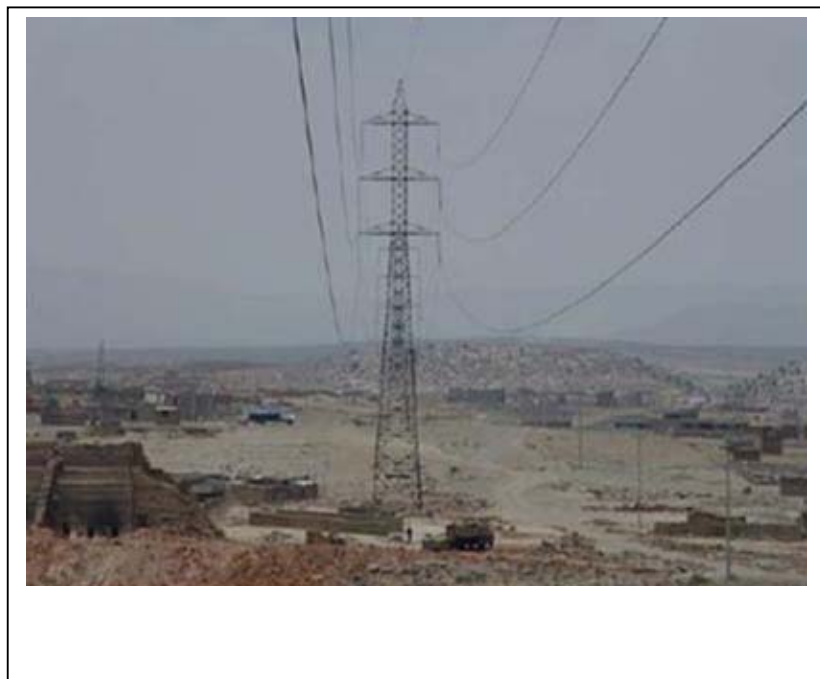
FIGURA N° 01 Invasión a la Faja de Servidumbre (área de secado de ladrillo)