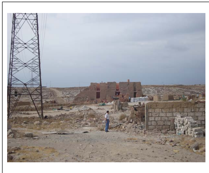
FIGURA N° 02 (Torre 4: área de secado de ladrillos)