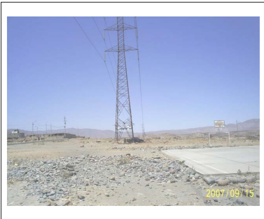
FIGURA N° 02 (Torre N° 5: A la derecha se aprecia la losa deportiva invadiendo parte de la faia de servidumbre)