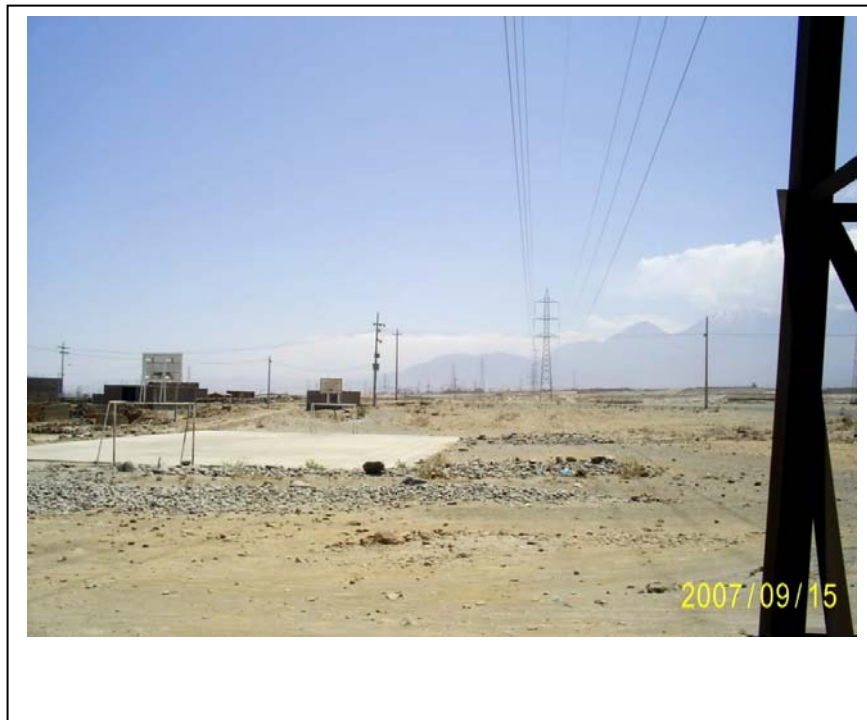
FIGURA N° 01 (Losa Deportiva invadiendo parte de la faja de servidumbre)