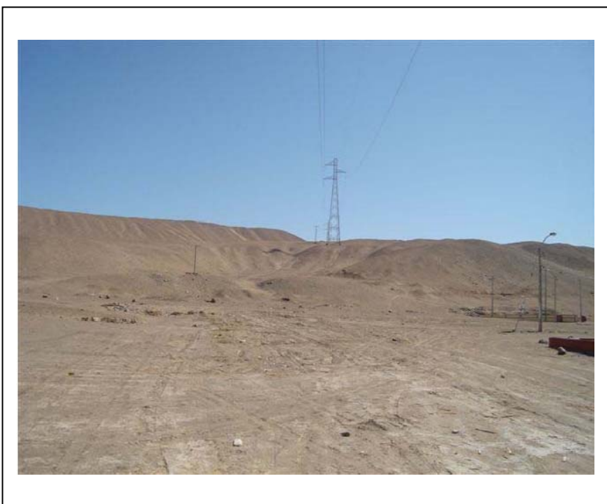
FIGURA N° 02 (Franja de Servidumbre del vano T130 a T131– Saneado)