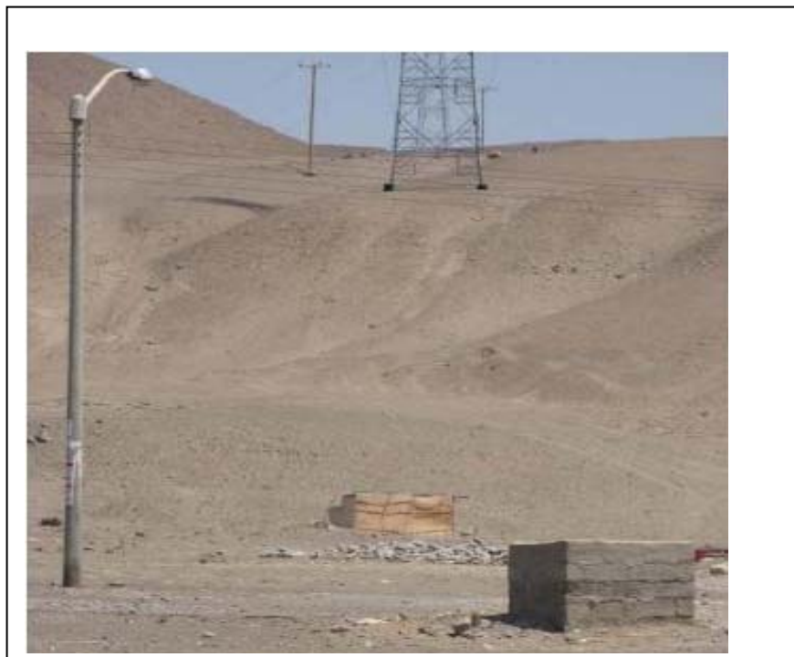
FIGURA N° 01 (Invasión en la Faja de Servidumbre vano T130 a T131)