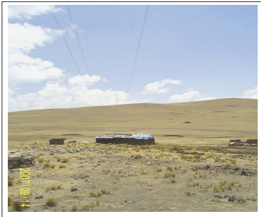
FIGURA N° 01 (Vista Torre N° 14: Se aprecia el depósito de estiércol dentro de la faja de servidumbre)