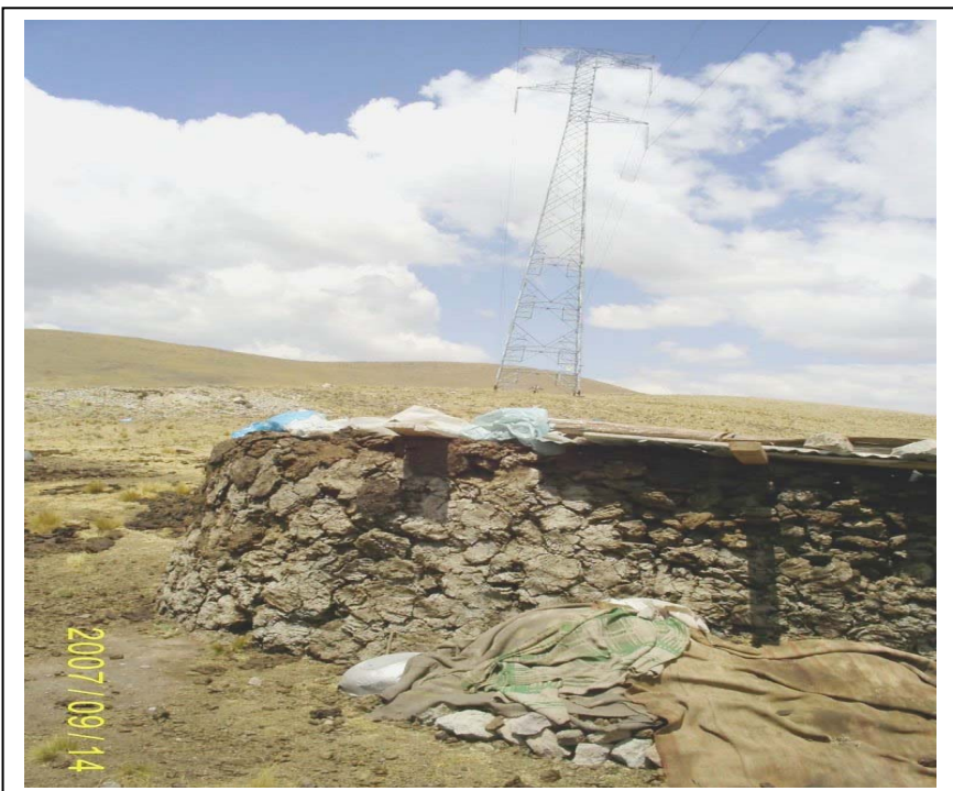
FIGURA N° 02 (Vista Torre N° 15: Se aprecia depósito de estiércol dentro de la faja de servidumbre)