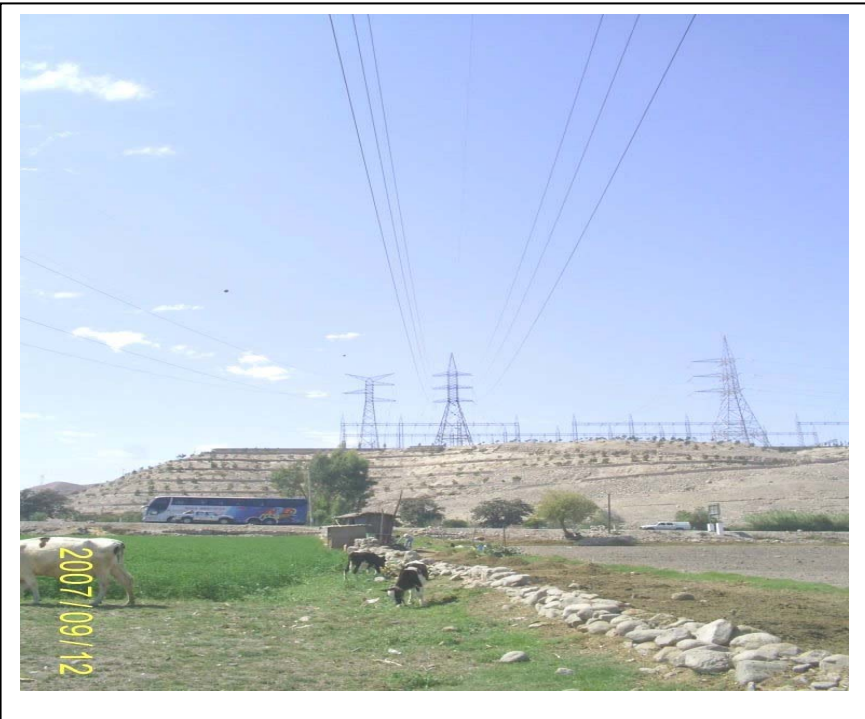
FIGURA N° 02 Vista Torre N° 229 (al fondo S.E. Moquegua): Se aprecia la vivienda precaria (choza) (D) dentro de la faja de servidumbre