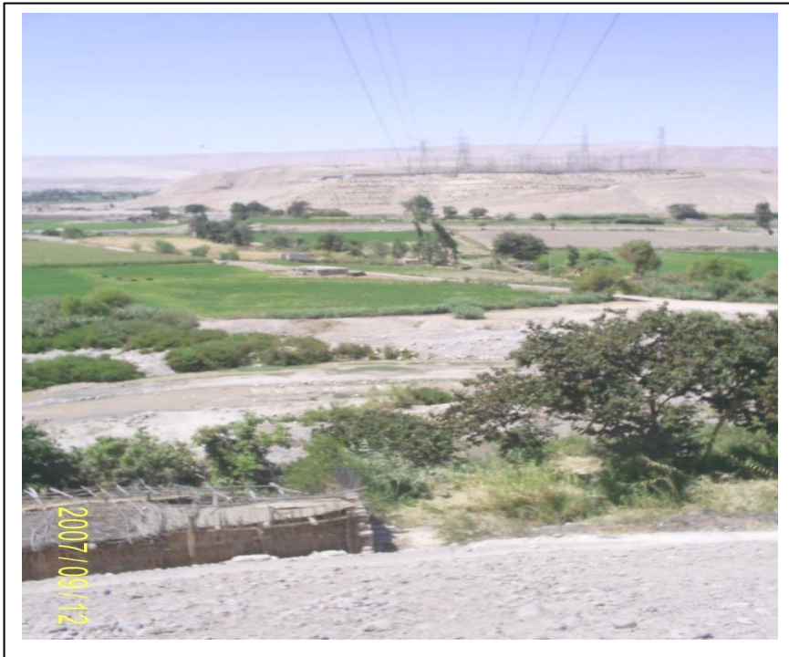
FIGURA N° 01 (Vista de la Torre N° 229 (al fondo S.E. Moquegua): Se aprecia 04 viviendas (chozas) precarias dentro de la faja de servidumbre)