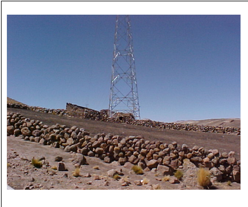
FIGURA Nº 01 (Vivienda precaria invadiendo franja, detrás de la estructura)