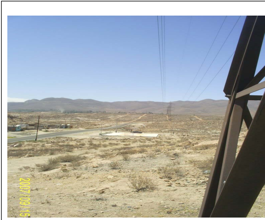
FIGURA Nº 01 (Vista de la Torre Nº 24: A la izquierda se aprecia la losa deportiva invadiendo parte de la faia de servidumbre)