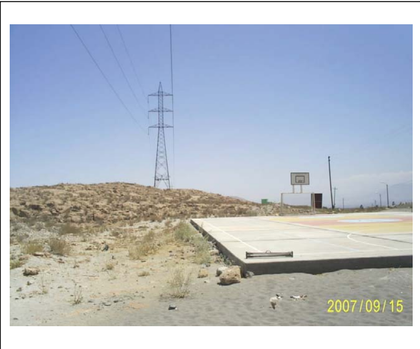
FIGURA Nº 02 Vista Torre Nº 24: Losa deportiva invadiendo la faja de servidumbre)