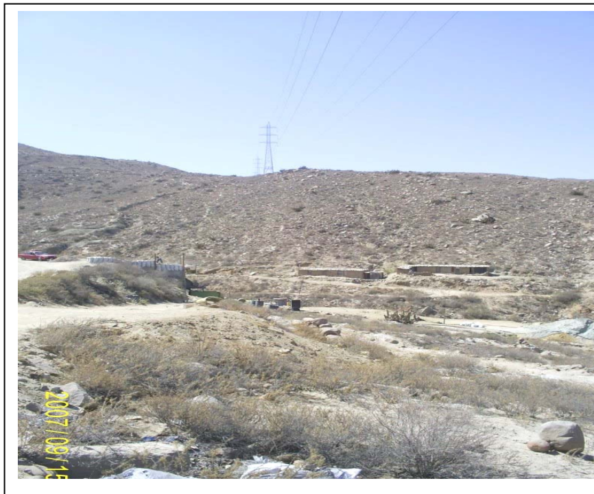
FIGURA N° 01 (Vista de la Torre N° 38: A la derecha se aprecia el campamento que invade la faia de servidumbre)