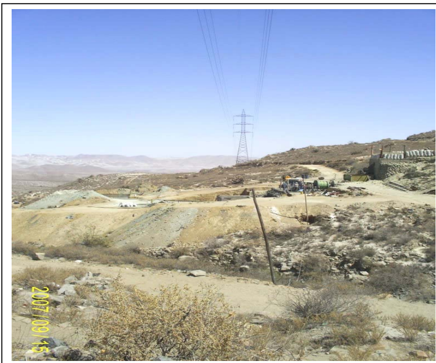
FIGURA N° 02 (Vista de la Torre N° 37: A la derecha se aprecia la Planta de chancado y flotación de la minera que invade la faja de servidumbre)