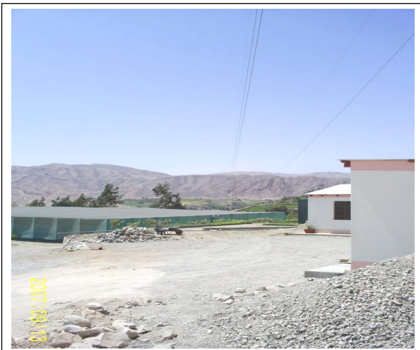
FIGURA N° 02 (Vista Torre N° 403 (al fondo): Se aprecia el Vivero Municipal, oficinas y almacén que invaden la faia de servidumbre)