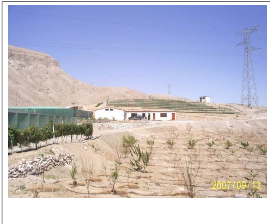
FIGURA N° 01 (Vista Torre N° 404: Se aprecia el Vivero Municipal invadiendo la faia de servidumbre)