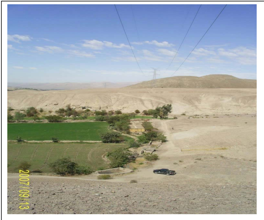
FIGURA N° 01 (Vista Torre N° 428: Se aprecia en el medio del vano la granja de crianza de cuyes invadiendo la faia de servidumbre)