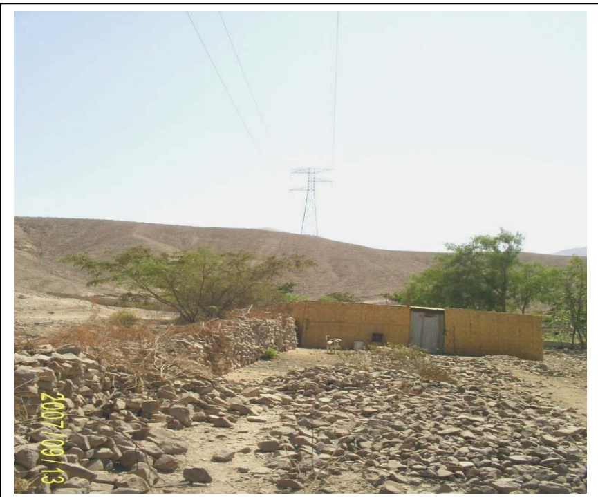
FIGURA N° 02 (Vista Torre N° 427 (al fondo): Se aprecia la granja de crianza de cuyes invadiendo la faja de servidumbre)