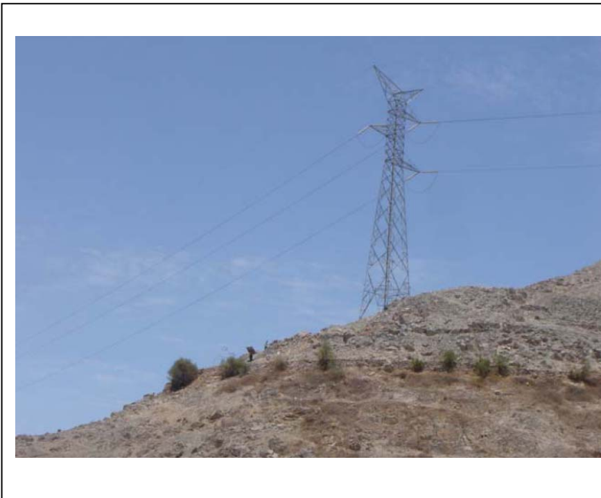
FIGURA N° 02 (Franja de Servidumbre del vano T428 a T429 – SANEADO)