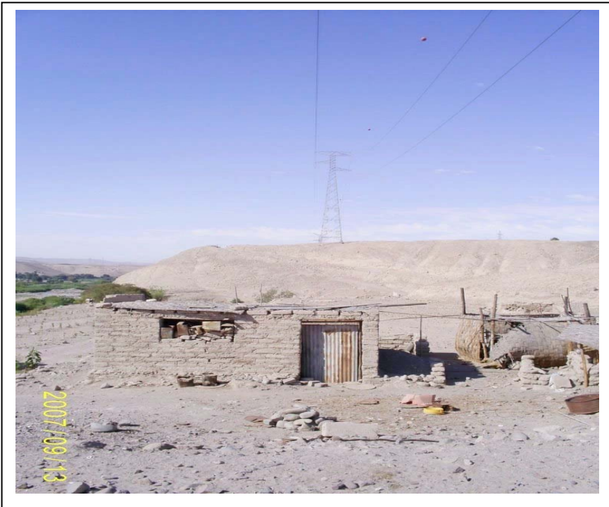
FIGURA N° 01 (Vista Torre N° 436: Se aprecia la vivienda precaria (A) invadiendo la faia de servidumbre)