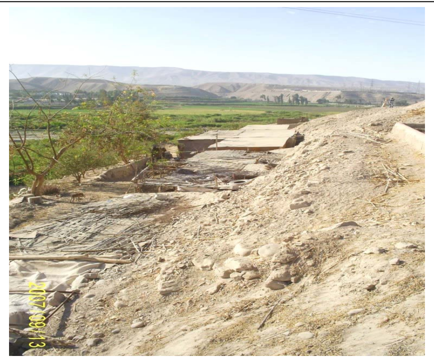
FIGURA N° 02 (Vista vano T435-T436: Se aprecia las viviendas precarias de adobe y madera que invaden la faja de servidumbre)