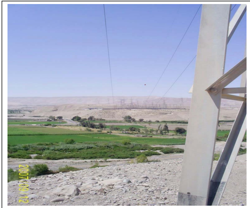
FIGURA N° 01 Vista Torre N° 438 (al fondo S.E. Moquegua): Se aprecia a medio vano la vivienda y la ex - planta de bombeo.