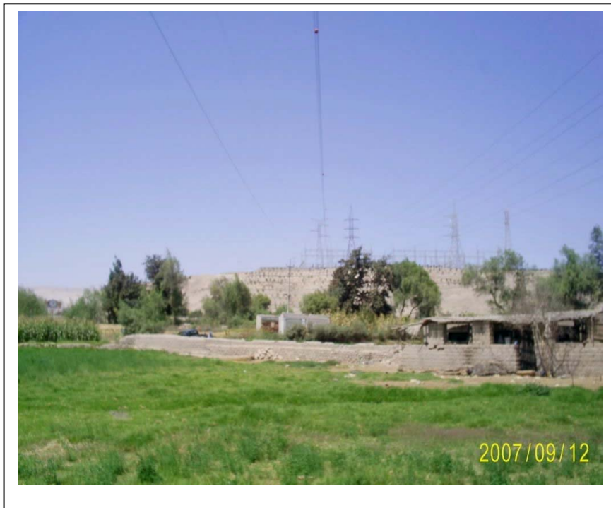
FIGURA N° 02 Vista Torre 438 (al fondo S.E. Moquegua): Se aprecia la vivienda precaria y la ex - planta de bombeo que invaden la faja de servidumbre