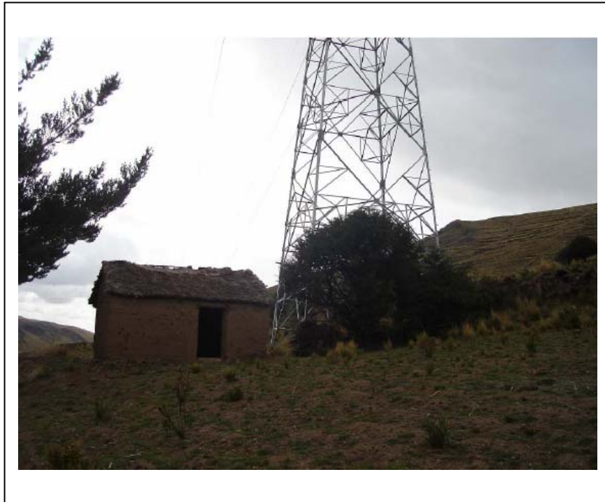
FIGURA Nº 01 (Construcción precaria de adobe)