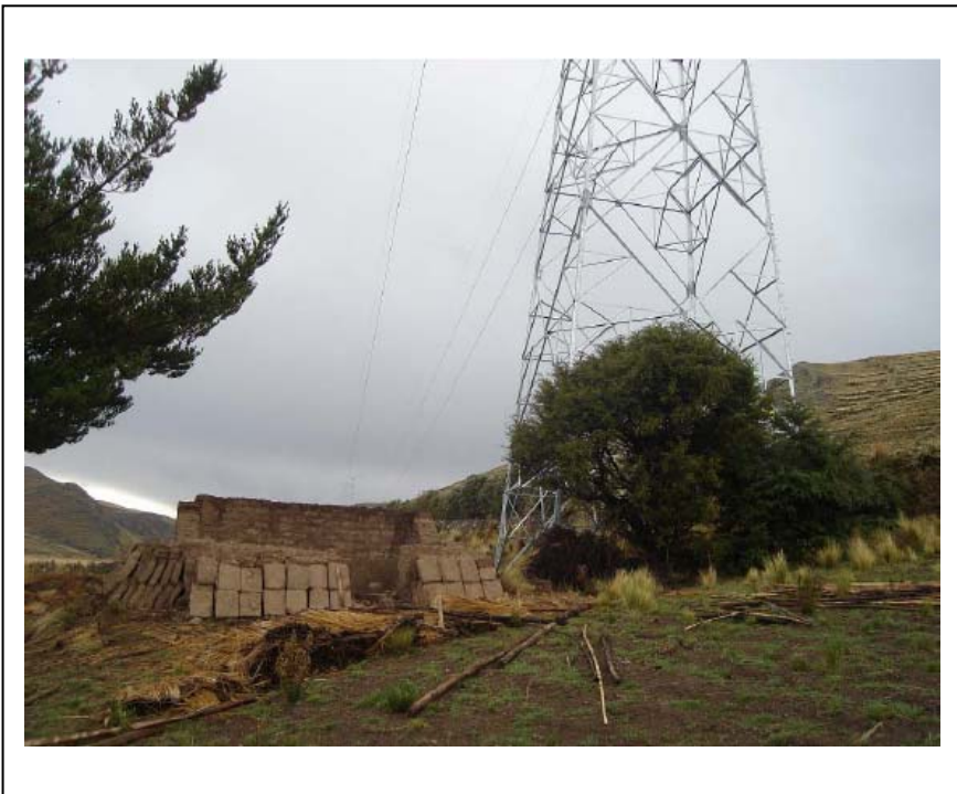
FIGURA Nº 02 (Franja de Servidumbre del vano T90 a T91 – SANEADO) Construcción demolida en proceso de limpieza