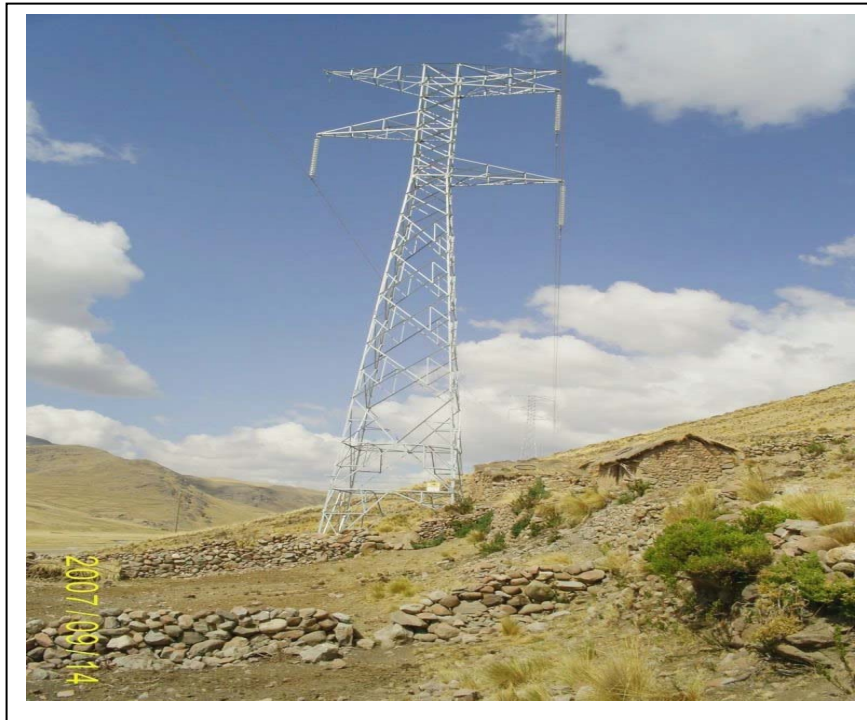
FIGURA N° 01 (Vista Torre N° 92: Se aprecia la vivienda precaria invadiendo la faia de servidumbre)