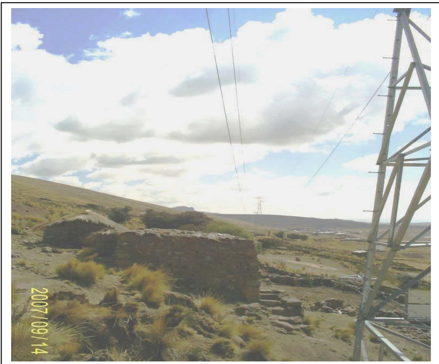
FIGURA N° 02 (Vista Torre N° 91 (al fondo): Se aprecia la vivienda precaria invadiendo la faja de servidumbre)